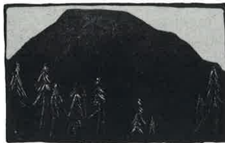
Holzchnitt von A. Lindenbauer